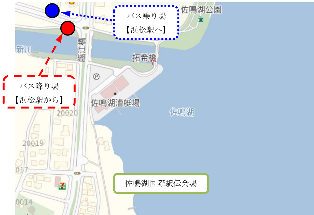
図.2 佐鳴湖漕艇場 遠鉄バス停（臨江橋）